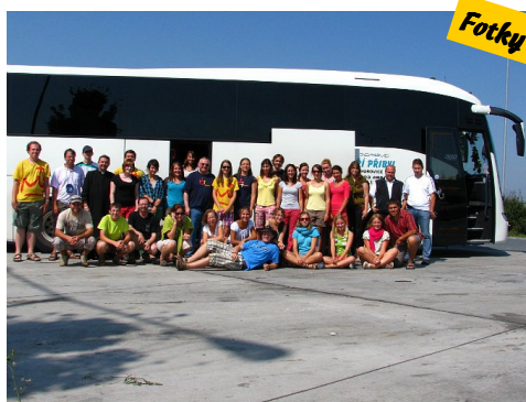
Fotky z WYD